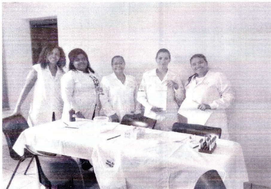
Segunda turma da capacitação de testes rápidos (HIV, sífilis, hepatite B e C) em 03/2023.